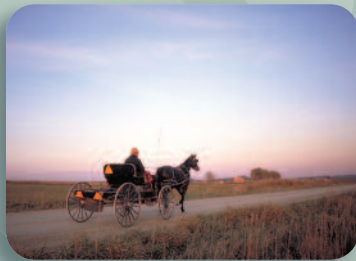
ST. JACOBS